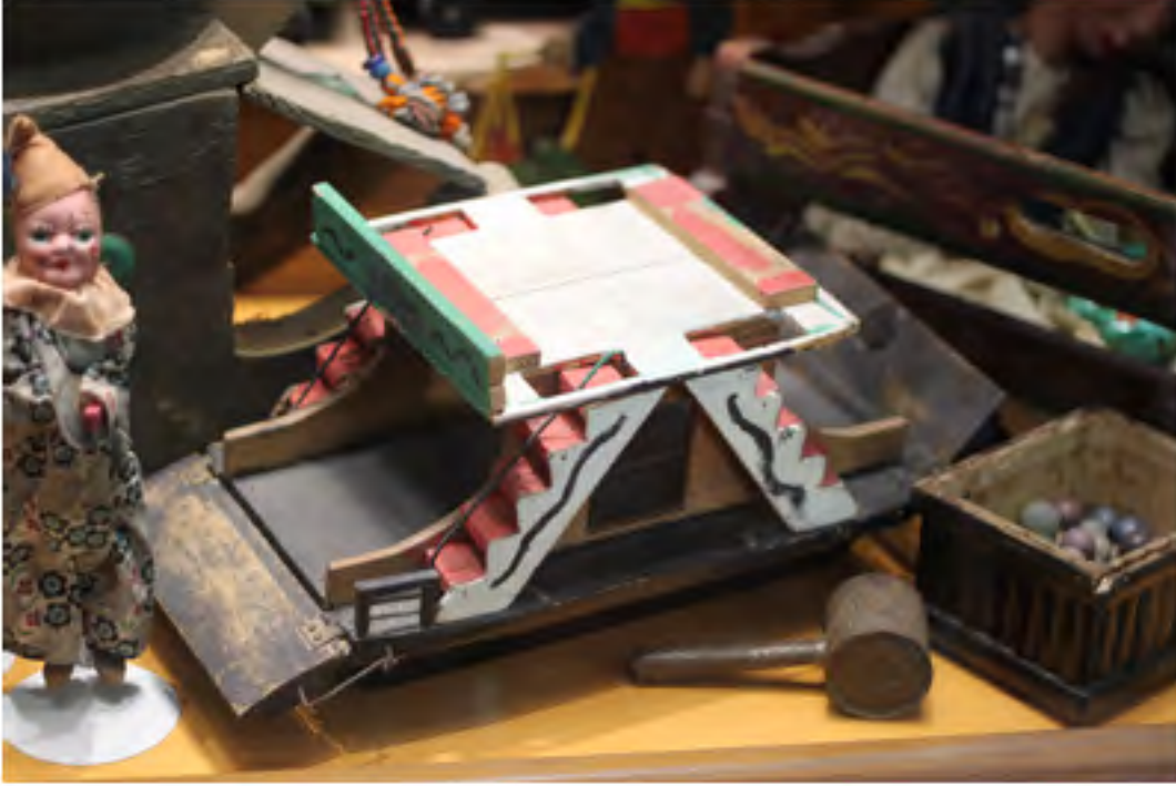
AHŞAP ARABALI VAPUR, EYÜP OYUNCAĞI, İSTANBUL, 1930'lar İstanbul Oyuncak Müzesi Koleksiyonu Fotoğraf: Avşar Gürpınar