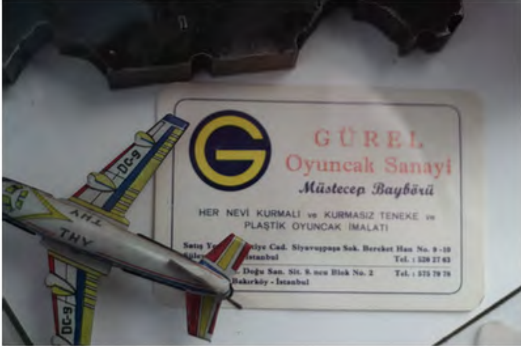
GÜREL OYUNCAKLARI'NIN TENEKE KALIPLARI, İSTANBUL, 1960-1970 İstanbul Oyuncak Müzesi Koleksiyonu