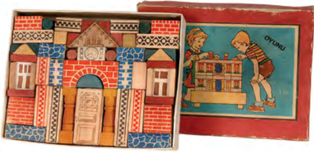
1 - İNŞAAT OYUNU, BAUKASTEN, ALMANYA, 1880 İstanbul Oyuncak Müzesi Koleksiyonu