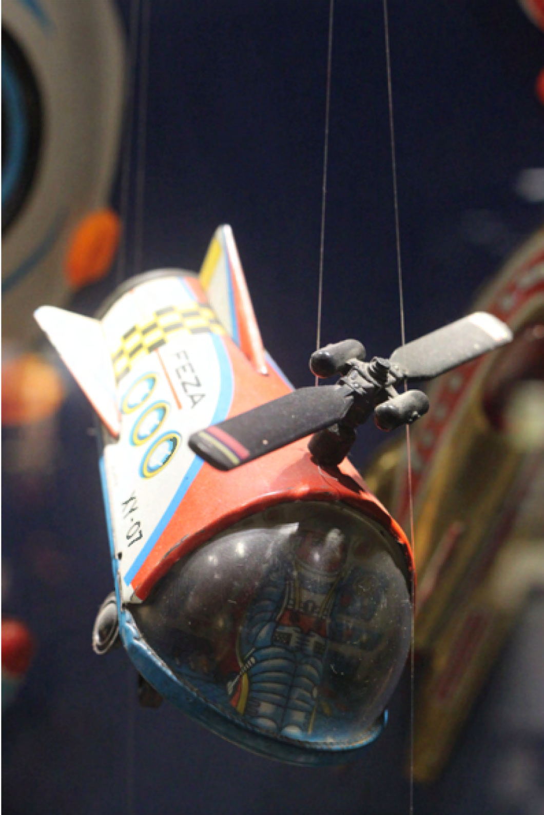
UZAY ARACI FEZA, NEKUR, İSTANBUL, 1960'lar İstanbul Oyuncak Müzesi Koleksiyonu