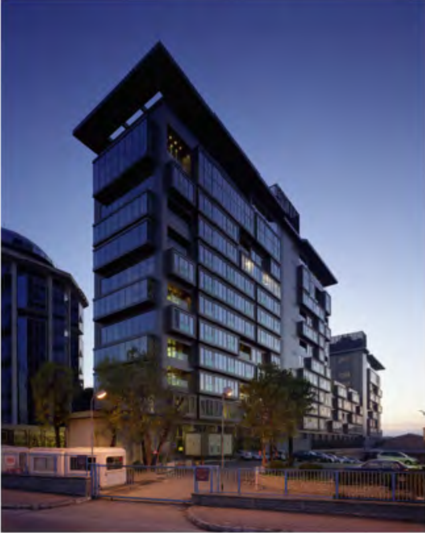
1 - SARI KONAKLAR, AKATLAR, İSTANBUL Mimari: Mutlu Çilingirođlu ve Adnan Kazmaođlu