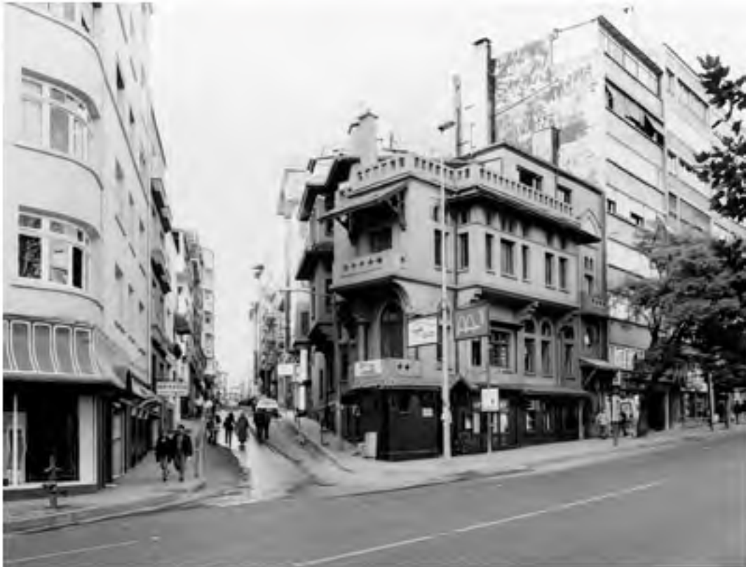
1 - VEDAD TEK EVİ II, VALİKONAĞI, İSTANBUL Mimari: Vedat Tek