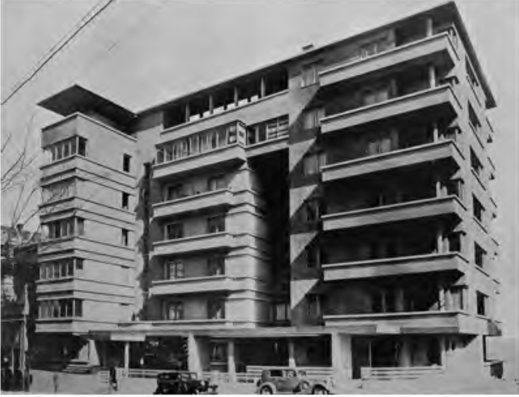
BİR KİRA EVİ, ÜÇLER APARTMANI, AYASPAŞA, İSTANBUL