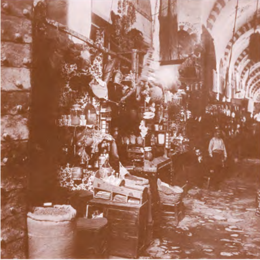
MISIR ÇARŞISI'NDA ÖNÜNDE GEMİ ALAMETİYLE BİR AKTAR, İSTANBUL