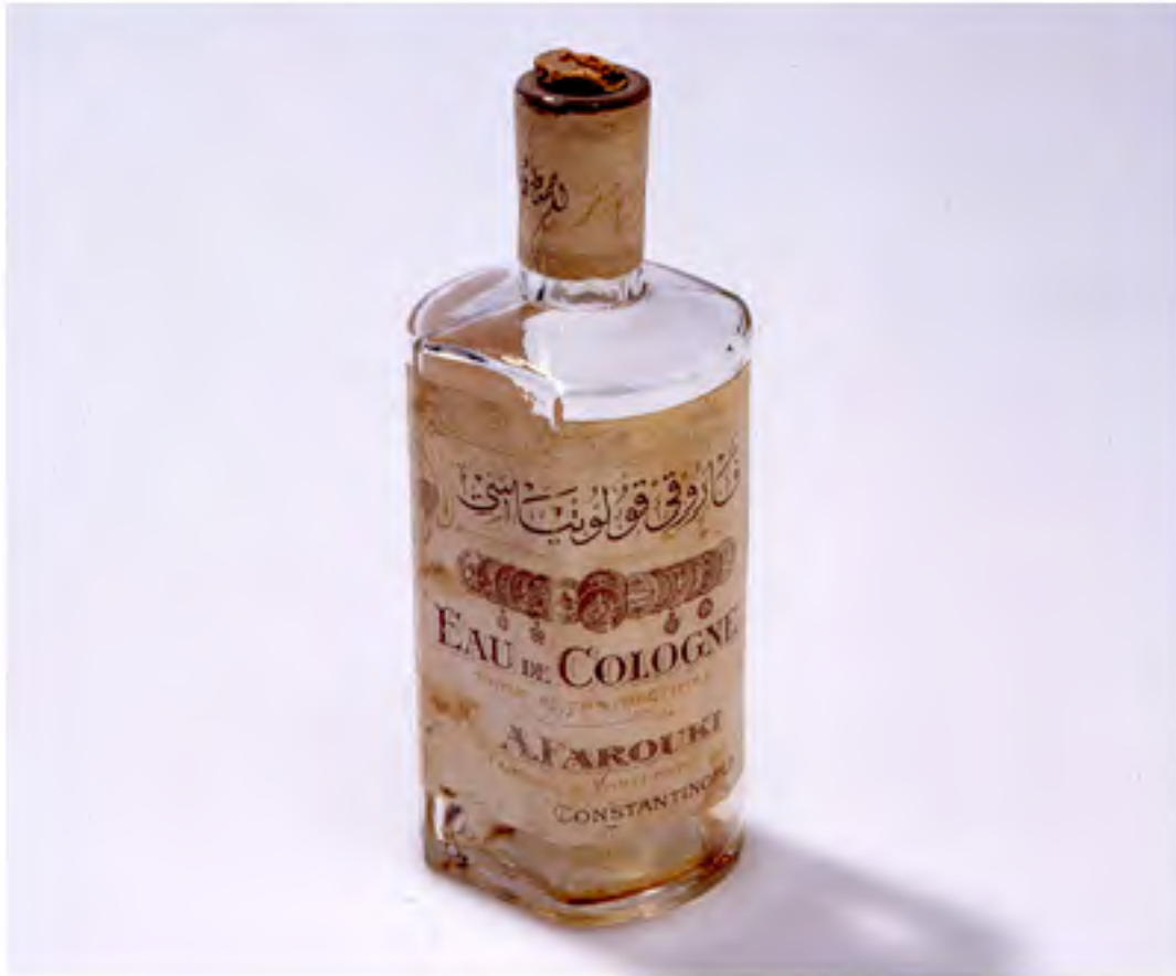
FARUKI KOLONYASI VE ETİKETİ