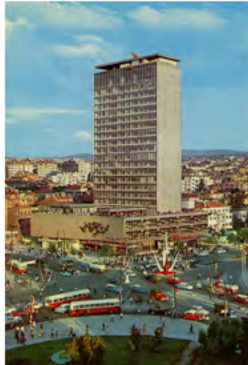
1 - ÇEŞİTLİ TARİHLERE AİT MİGROS BÜLTENLERİ