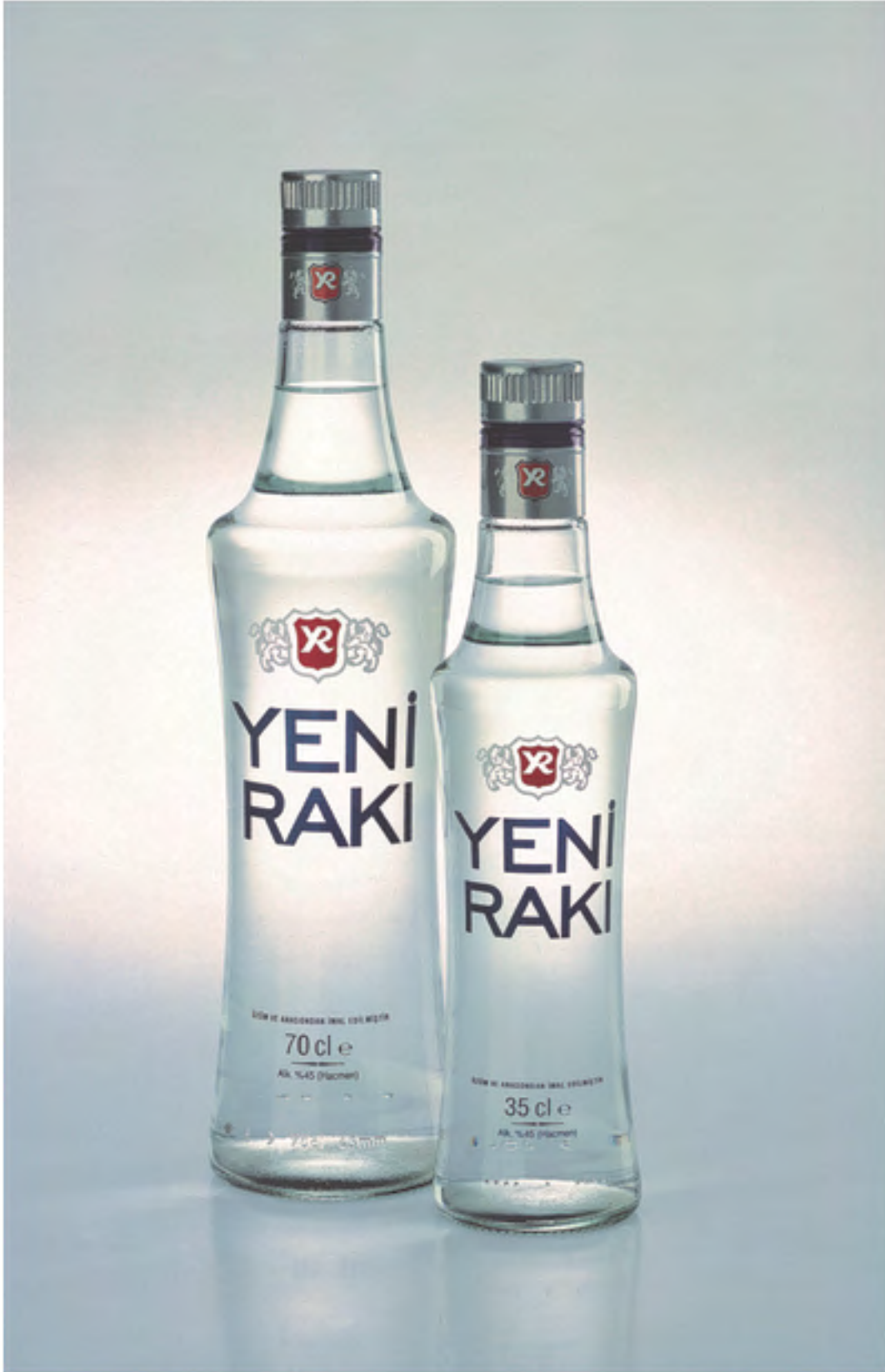
YENİ RAKI AMBALAJ TASARIMI, 2006