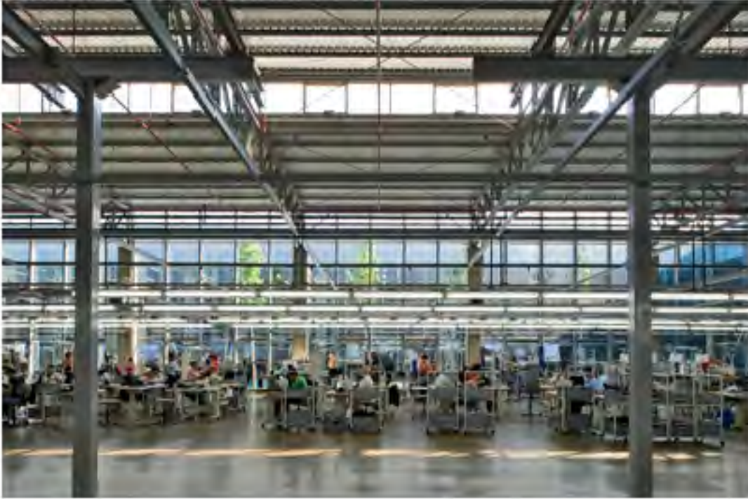
1 - İSTANBUL GÖN DERİ FABRİKASI-2 Mimari: Nevzat Sayın (NSMH)