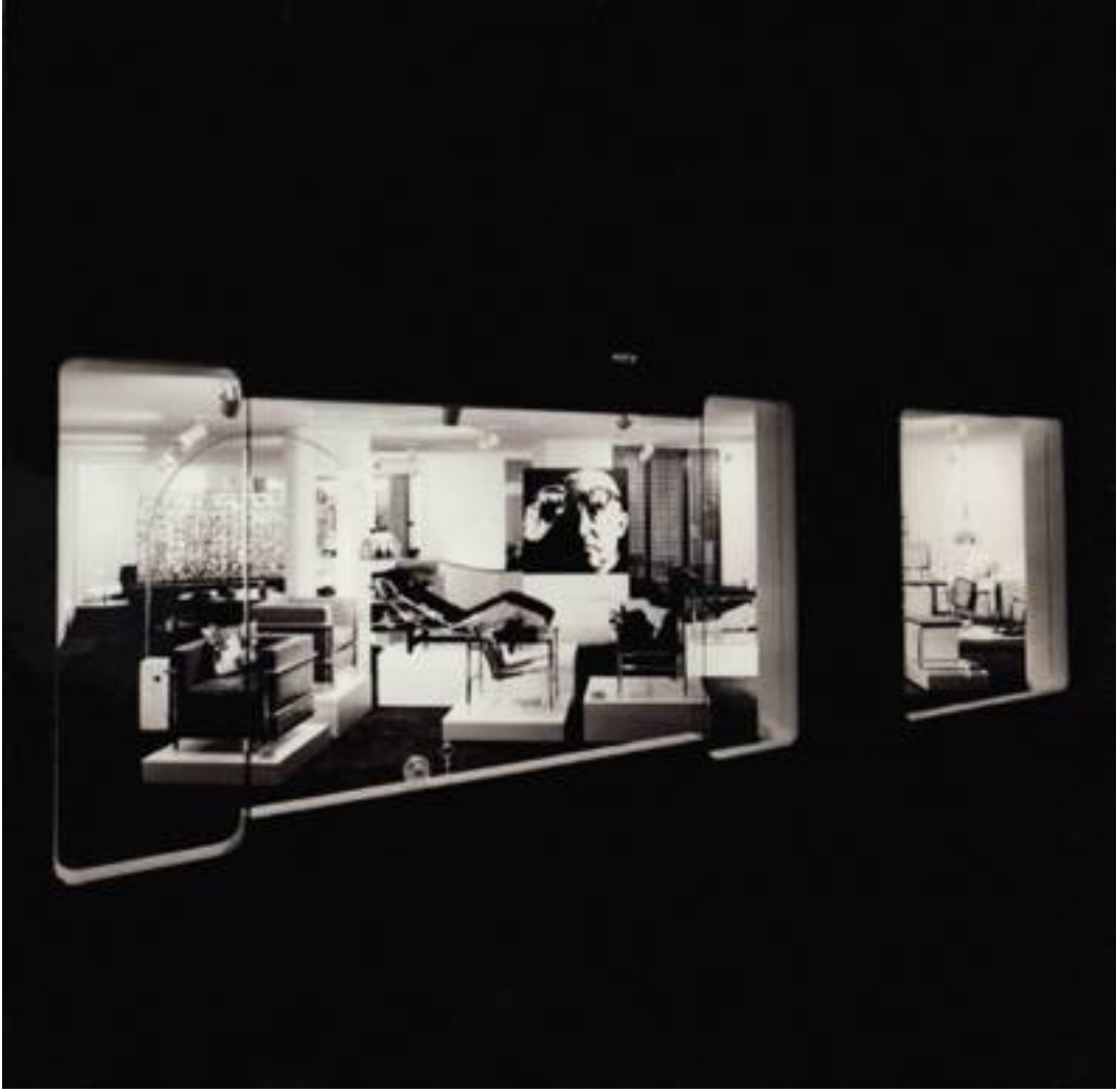
INTERNO, NİŞANTAŞI, İSTANBUL