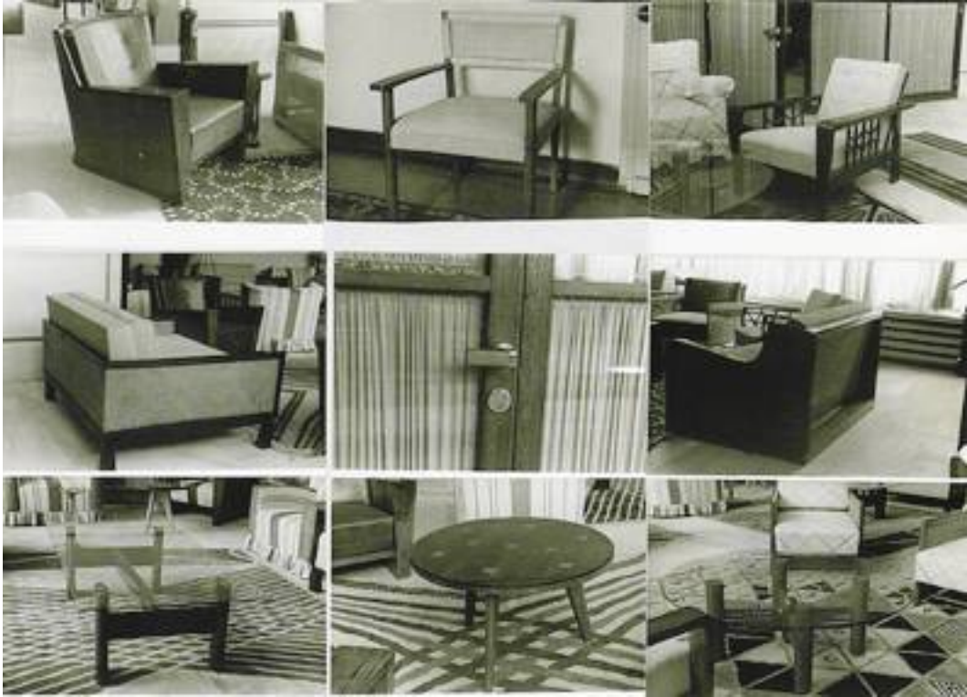
1 - DÖRT KARDEŞ İÇİN OTURMA VE ÇALIŞMA ODASI, DEKORATÖR NİZAMİ BEY'İN TASARIMI Kaynak: "Dahili Mimari." Arkitekt , 2. Yıl, sayı 5 (17), s. 145, 1932.