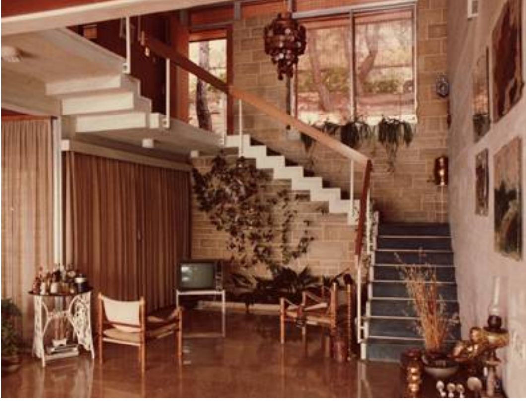
KAMHI-GRÜNBERG EVİ, BURGAZADA / UTARİT İZGİ TASARIMI