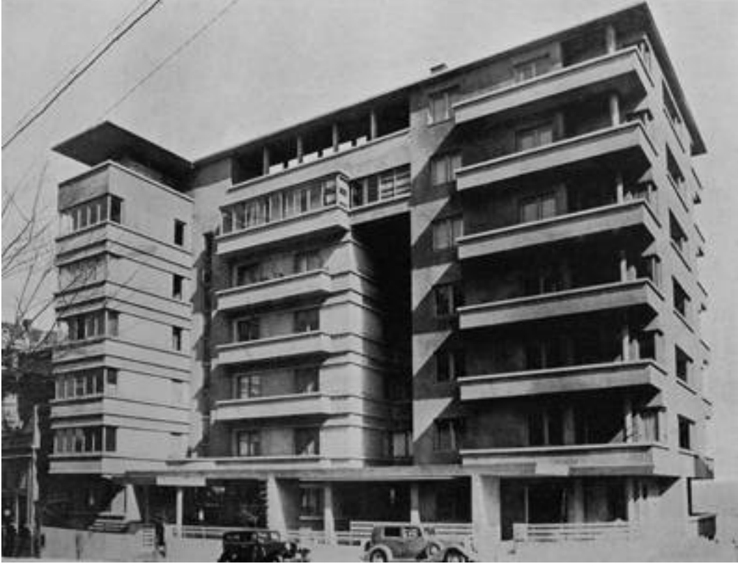
BİR KİRA EVİ, ÜÇLER APARTMANI, AYASPAŞA, İSTANBUL