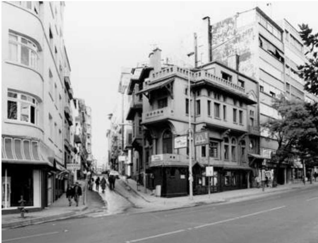
1 - VEDAD TEK EVİ II, VALİKONAĞI, İSTANBUL Mimari: Vedat Tek Kaynak: Pelin Derviş ve Suha Özkan Koleksiyonu