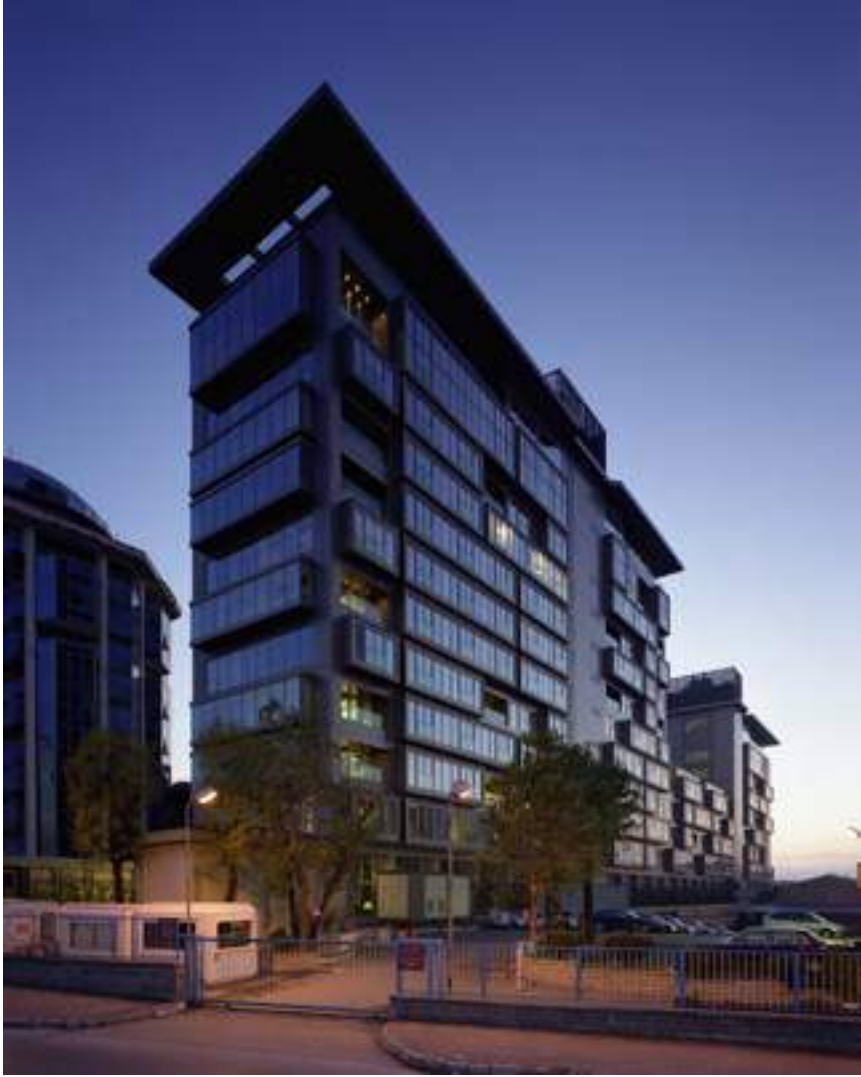
1 - SARI KONAKLAR, AKATLAR, İSTANBUL Mimari: Mutlu Çilingirođlu ve Adnan Kazmaođlu